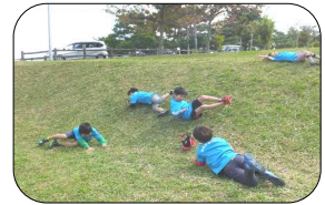
コザ運動公園にて(映画観賞当日)